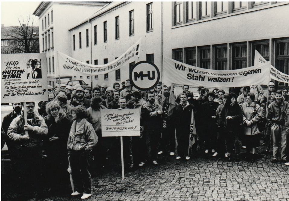
Abb. 2. Protestaktion Herbst 1991 für den Erhalt der Maxhütte Unterwellenborn